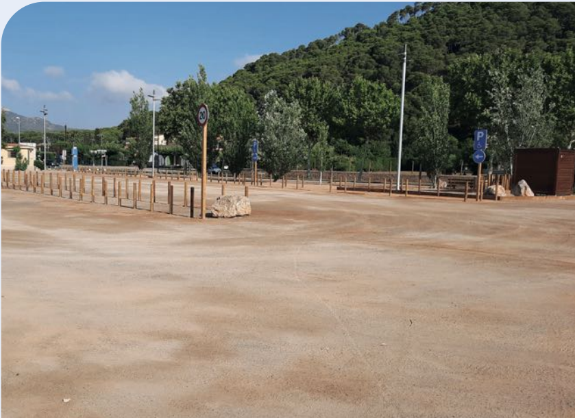
Nou espai de benvinguda amb pàrquing dissuassiu a l'Estartit.