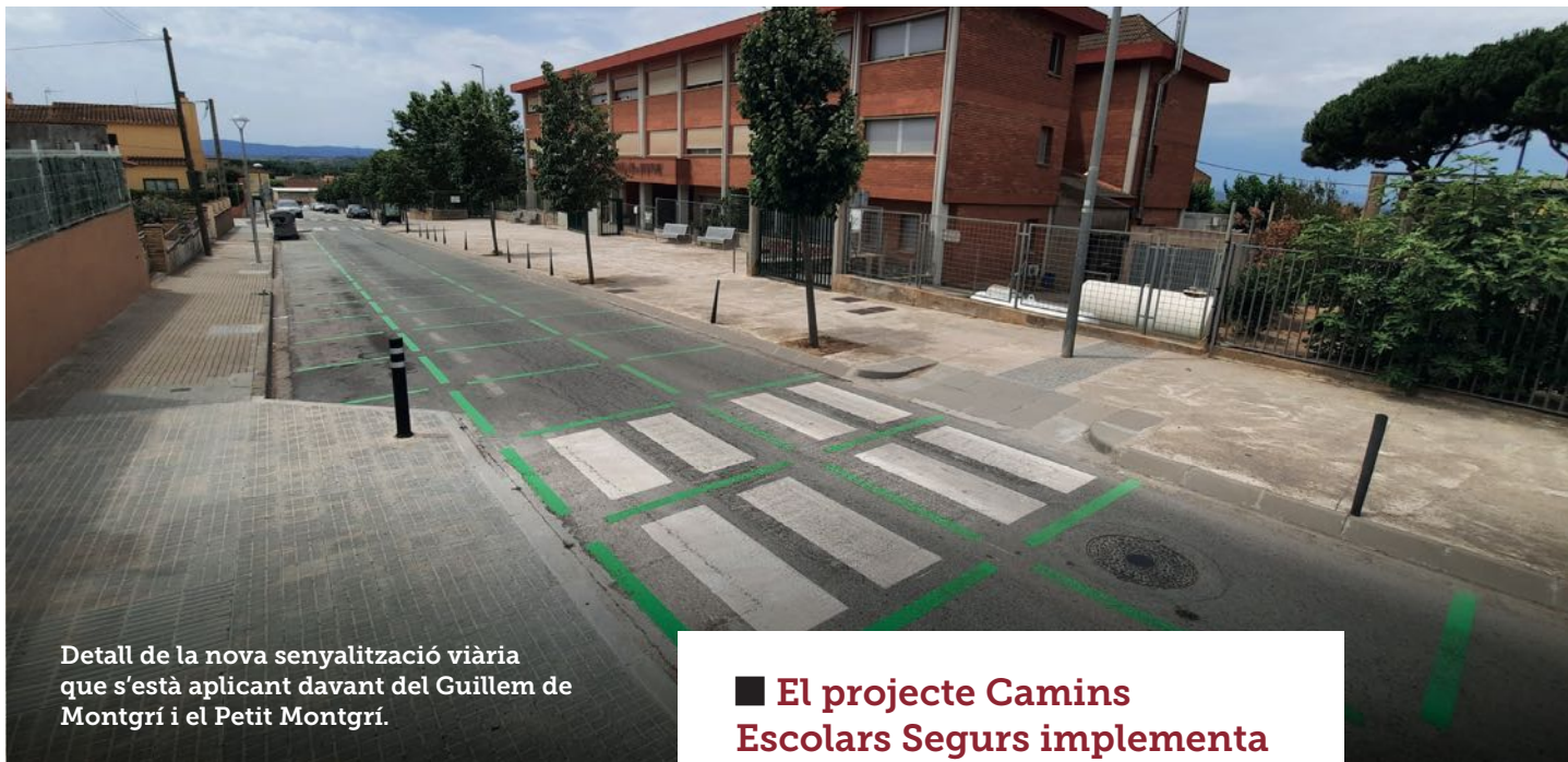
Detall de la nova senyalització viària que s'està aplicant davant del Guillem de Montgrí i el Petit Montgrí.