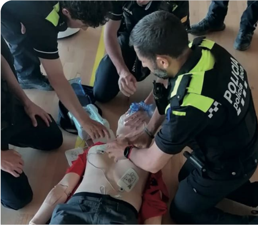
Imatge d'una de les formacions periòdiques de primers auxilis i utilització del defibril·lador que s'organitzen a la Policia Local.