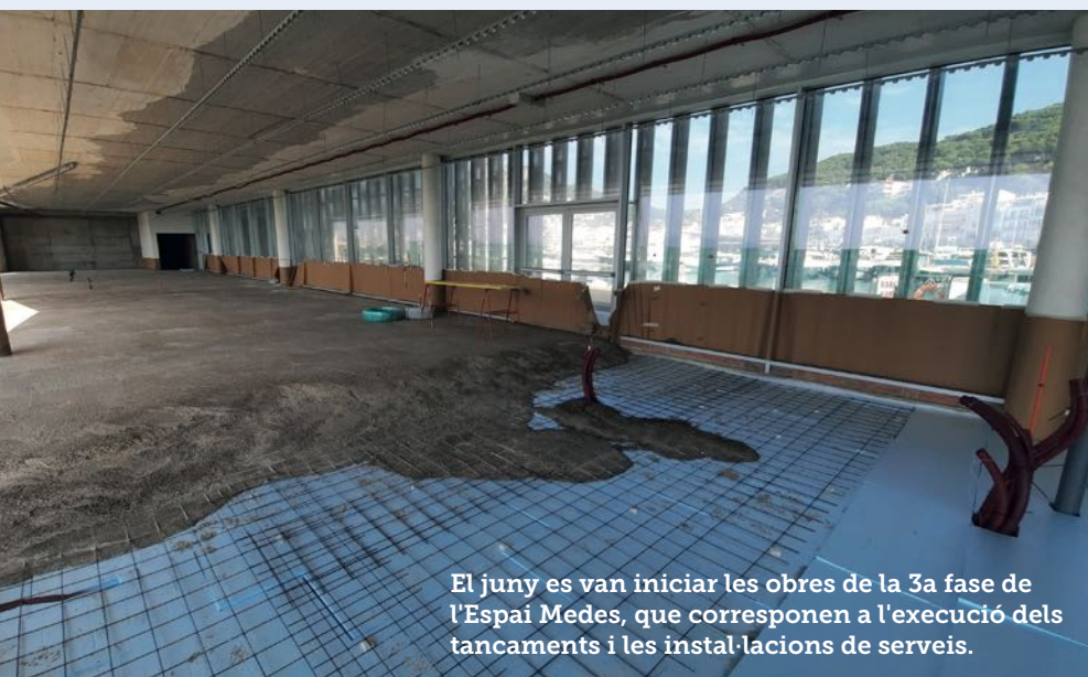
El juny es van iniciar les obres de la 3a fase de l'Espai Medes, que corresponen a l'execució dels tancaments i les instal·lacions de serveis.

El Pla de Sostenibilitat, dotat amb 3,6 milions d'euros, és un projecte estratègic per consolidar i donar un nou impuls al treball de regeneració de la destinació que, des de fa tres dècades, s'està desplegant al nostre municipi.