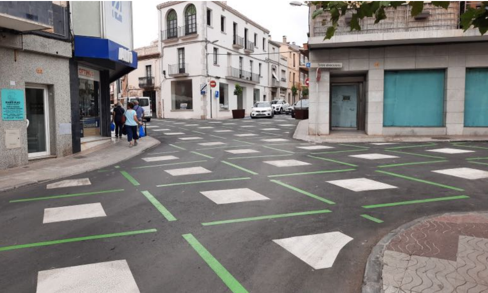
La nova senyalització en aquesta intersecció indica que la prioritat de pas és per a vianants. La velocitat està limitada a 20 km/h

Més segur i major qualitat urbana per a vianants i conductors